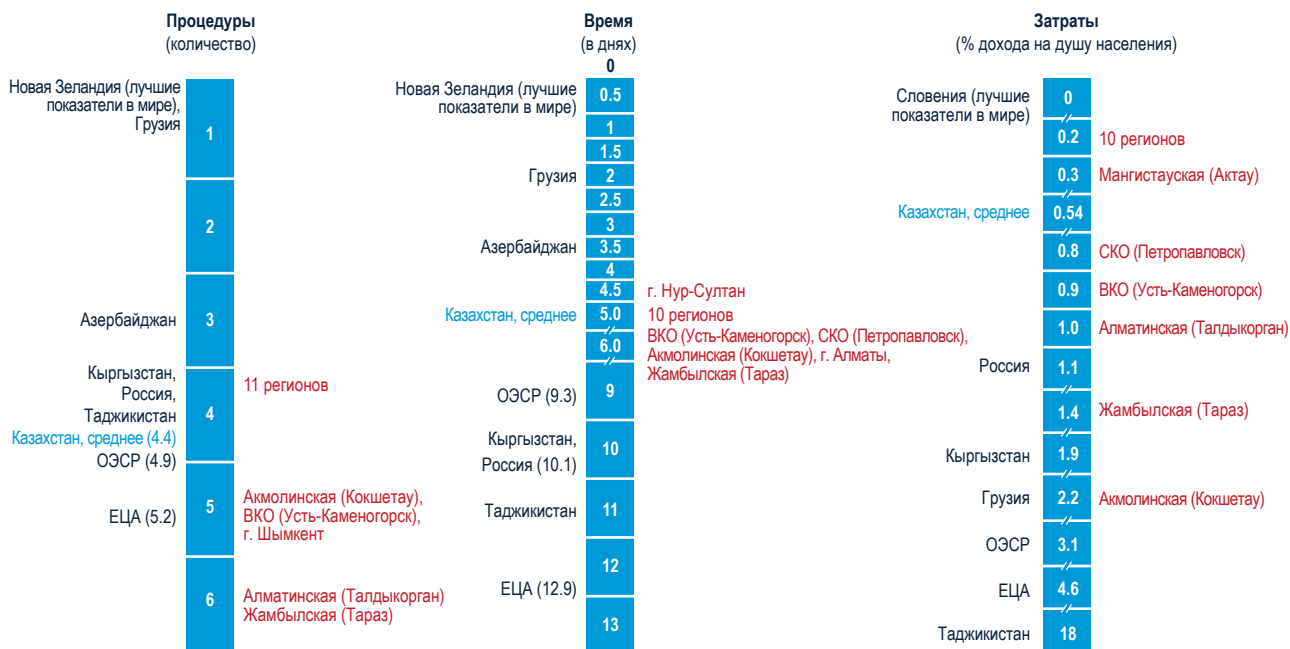
РИСУНОК 3.4 Регионы Казахстана опережают страны, с которыми проводится сравнение, по уровню затрат, но отстают по другим показателям