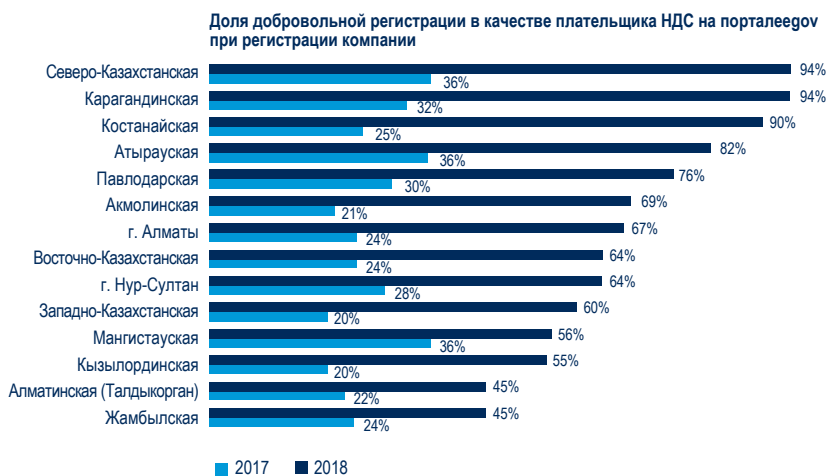
РИСУНОК 3.3 Добровольная регистрация в качестве плательщика НДС при регистрации компании — наиболее распространенный способ регистрации в качестве плательщика НДС во всех регионах, кроме двух

Время, необходимое для открытия предприятия, варьируется от 4,5 до 6 дней. Больше всего времени требуется в пяти регионах, где предприниматели обычно пользуются услугами юристов для регистрации компании (Рисунок 3.4). 17 Регистрация компании с помощью юриста занимает время; необходимо предварительно подготовить и проверить учредительные документы, прежде чем регистрировать компанию от имени предпринимателя.