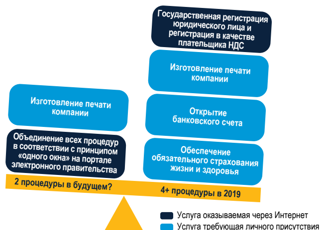
РИСУНОК 3.1 Полная автоматизация значительно упрощает процесс регистрации предприятий

Последний этап — обязательное страхование жизни и здоровья работников от несчастных случаев при исполнении обязанностей. Страхование должно быть оформлено в течение первых 10 дней месяца, следующего за датой государственной регистрации. 15 Три страховые